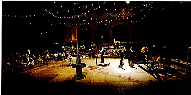
« Il s'agit d'un opéra populaire qui, à la fois, rend hommage à l'histoire du genre tout en chamboulant ses codes, ses hiérarchies. »

« L'idée du personnage de Faust vendant son âme au Diable a été abordée sous différentes lectures par de nombreux compositeurs. Au XVII e siècle, les philosophes se sont emparés de ce mythe pour évoquer le rapport de l'homme à Dieu. En écrivant sa version, Michel Butor ne donne pas d'issues précises. Il choisit de placer l'histoire dans le contexte de nos démocraties. La dualité entre le bien et le mal qui caractérise la pièce se retrouve dans la dualité de la démocratie, entre l'harmonie, ou